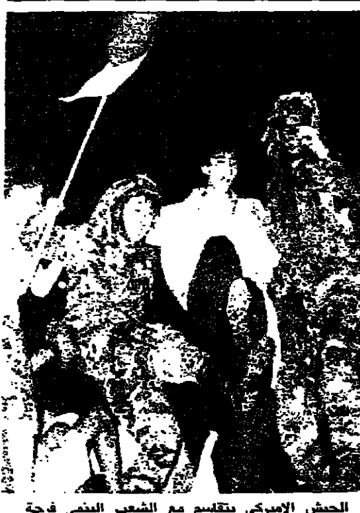
الجنرال اميركي يتلقى مع الشعب اللبناني فرحة استلام تورييغا.